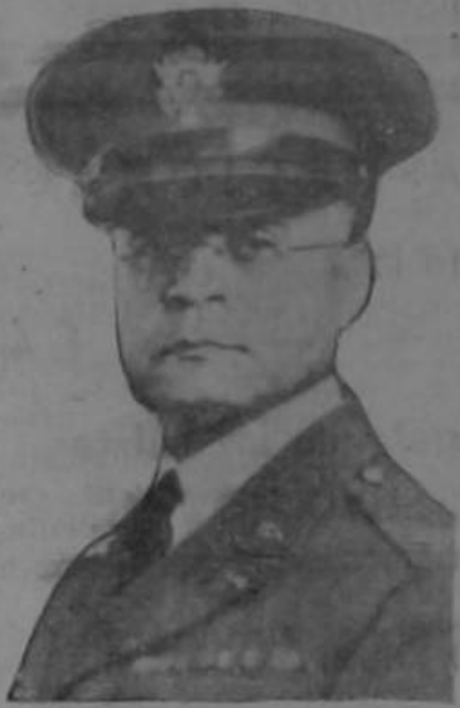
General BENJAMIN O. DAVIS

The first member of the Coloured race to obtain the position of a General in the Army of the United States of America. He is attached to the Artillery Division and has charge of a Brigade